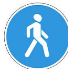
Знак 4.5.1 «Пешеходная дорожка»