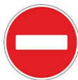
Знак 3.1 «Въезд запрещен»