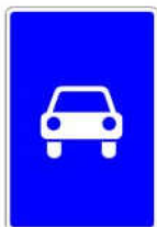
5.3 «Дорога для автомобилей»