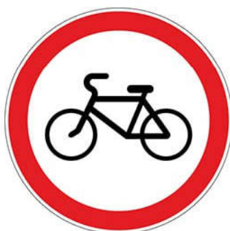
Запрещающий знак 3.9 «Движение на велосипедах запрещено»