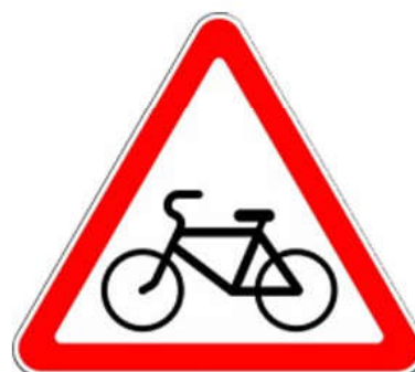
Предупреждающий знак 1.24 «Пересечение с велосипедной дорожкой»